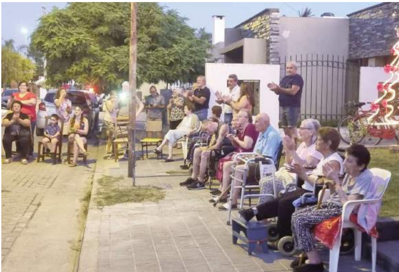
VILLA SANTA ROSA