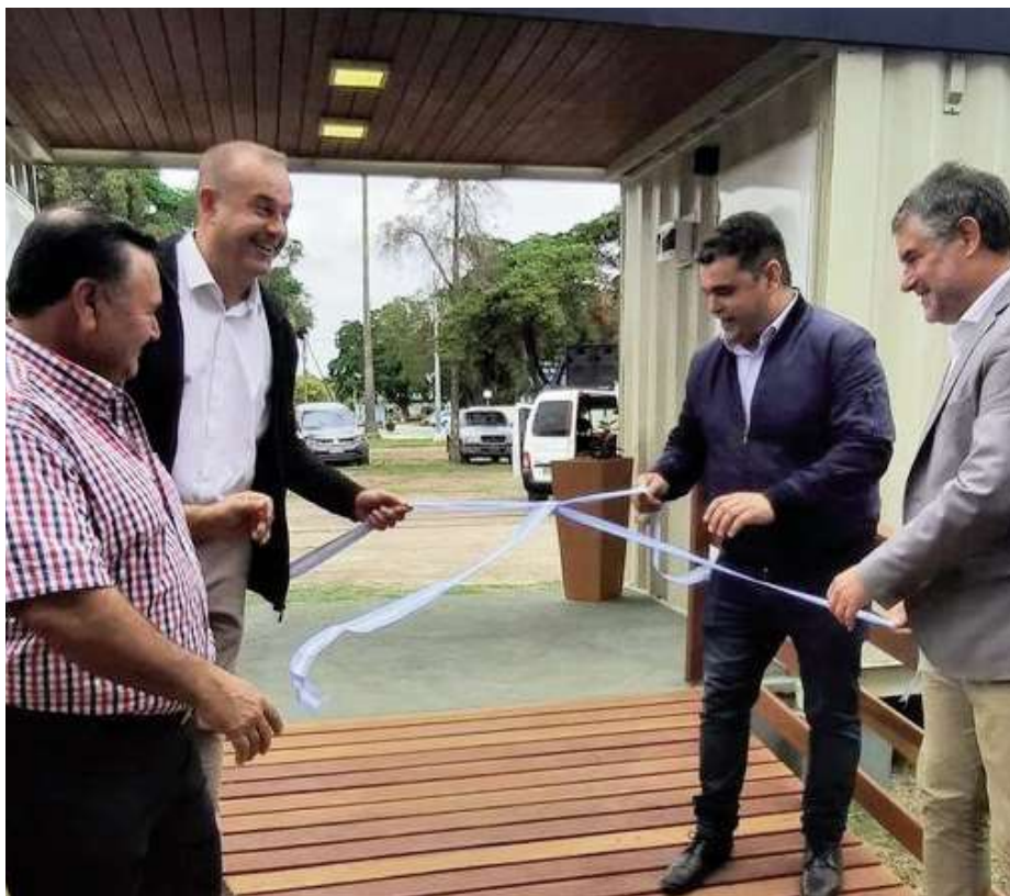
de se dejó inaugurado un nuevo local Comercial y Gastronómico, que permitirá a comercios de la

Seguidamente la actividad tuvo continuidad en el Paseo de los Artesanos y Emprendedores, don-