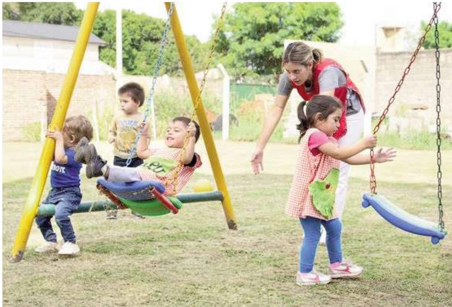
VILLA SANTA ROSA