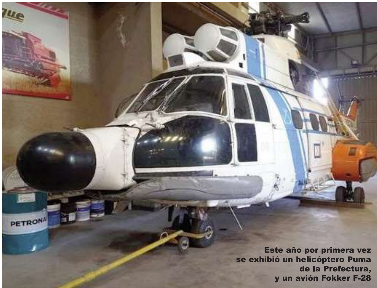
Este año por primera vez se exhibió un helicóptero Puma de la Prefectura, y un avión Fokker F-28