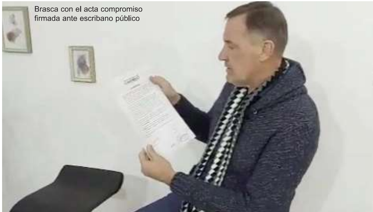
Brasca con el acta compromiso firmada ante escribano público

verdad, hubiese preferido que me lo digan. Creo en una política sana y quiero eso para nuestro departamento, debemos ser capaces de dar nuestro ejemplo, de demostrar lo que queremos. Yo quiero otra política para mi país y eso es lo que voy a defender hasta mis últimos días", cerró el candidato.