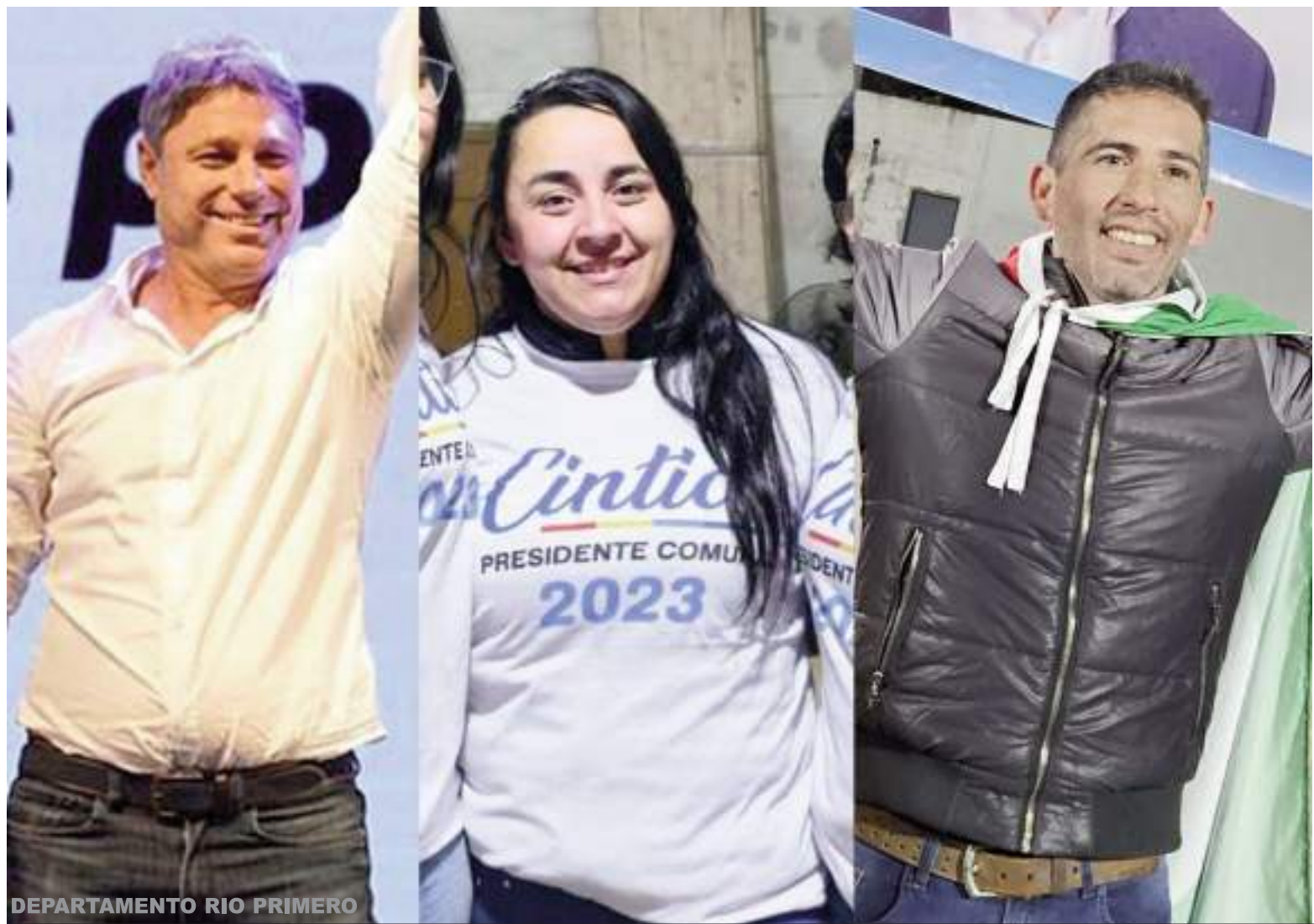
DEPARTAMENTO RIO PRIMERO