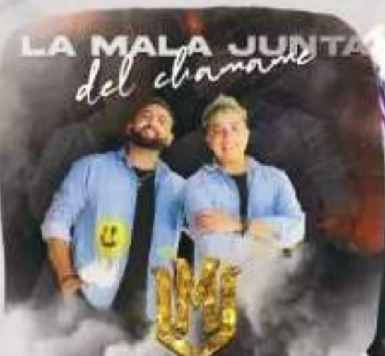
LA MALA JUNTA DEL CHAMAMÉ