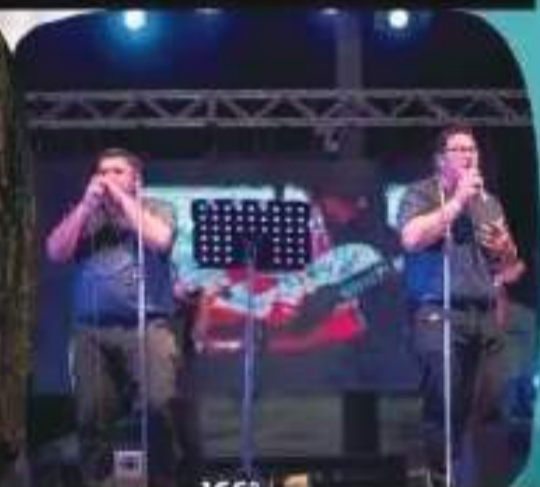
DÚO CANTO DEL NORTE