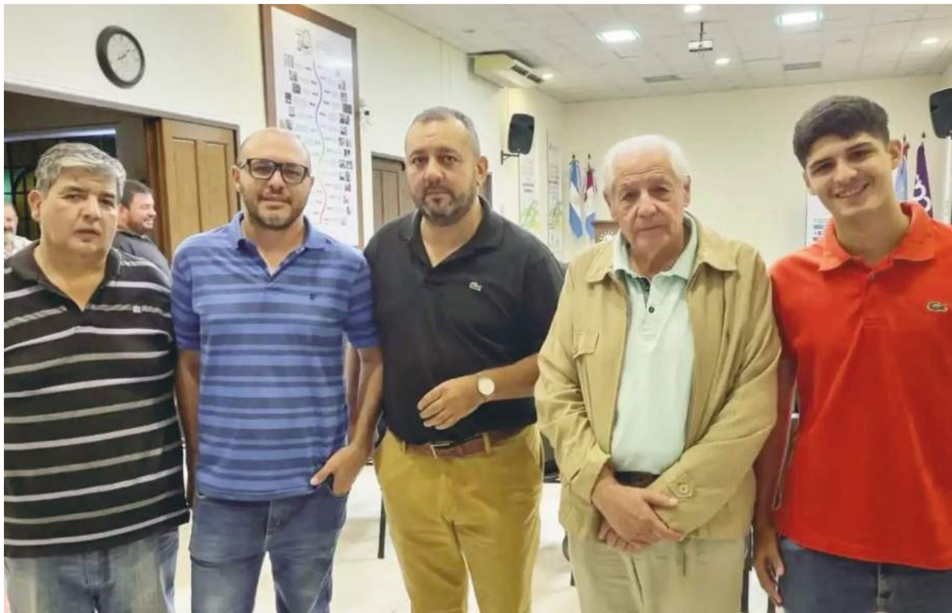
TRANSPORTE DE CARGAS